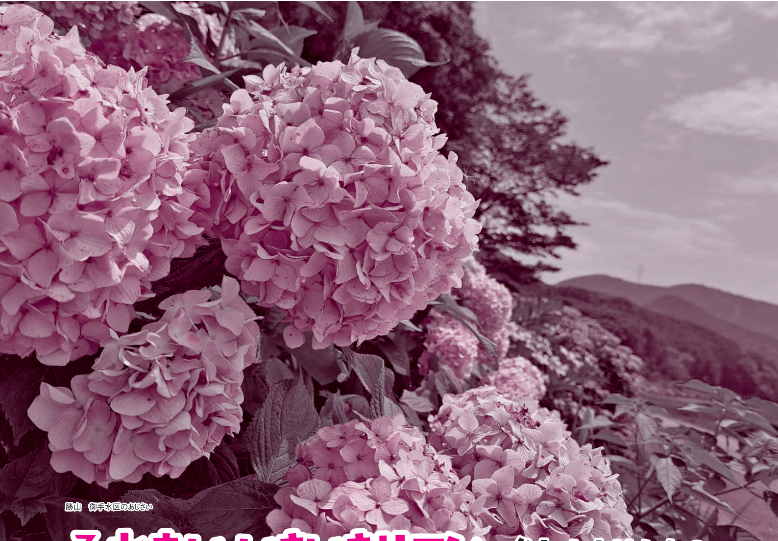
勝山 御手水区のおじい